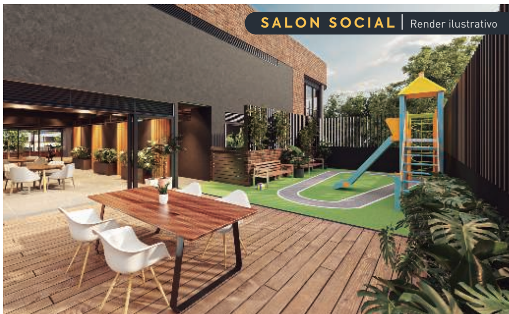
SALON SOCIAL | Render ilustrativo