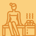
TURCO Y SAUNA