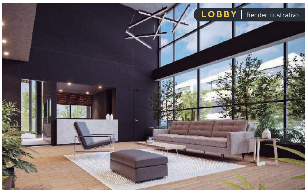
LOBBY | Render ilustrativo